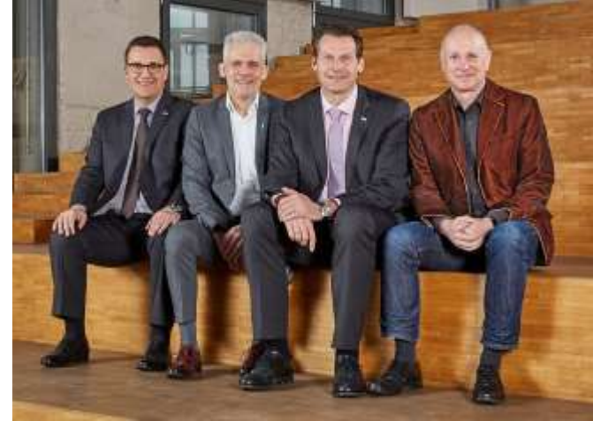
Die Hochschulleitung der htw saar